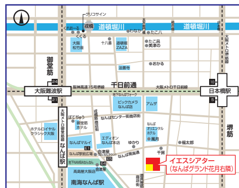
「鉄板会議2023」全国大会 会場マップ